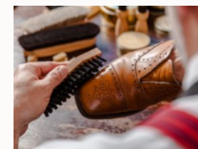
Apprendre et essayer les étapes du travail de A à Z

Au cours d'un programme intensif de 4 jours, vous apprendrez les connaissances de base d'un entretien de la chaussure professionnel et haut de gamme. Les conférenciers de l'ESSA vous parleront de leur expérience et vous montreront la voie à suivre. Vous apprendrez à différencier les différents modèles de chaussures et types de cuirs. Un diplôme officiel atteste de votre réussite au programme et de vos compétences acquises dans l'entretien de la chaussure. *mallette de cirage avec équipement de base inclus