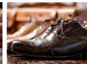
Welche Investitionen sind sinnvoll und welche nicht ?