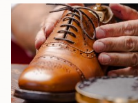
Schuhpflege beruflich zu betreiben will gelernt sein.

Wer sich als Schuhputzer selbständig machen möchte, benötigt nicht nur ein Grundlagen-Wissen wie es im ESSA-Training vermittelt wird. Hinzu kommen Kenntnisse zum Marketing, in der Buchhaltung, Presse-Arbeit und vieles mehr. Damit der Schritt in die Selbständigkeit bestmöglich vorbereitet wird, hilft ein 1-Wöchiges individuell zugeschnittenes ESSA-EXISTENZ-GRÜNDUNGS-PROGRAMM.