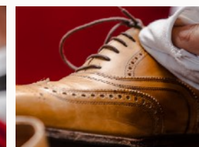
Sicheren Umgang mit Sonderfällen trainieren.