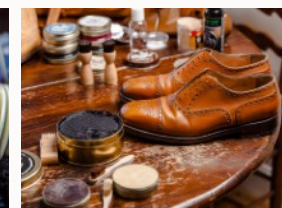
Für jeden Zweck das richtige Mittelchen.